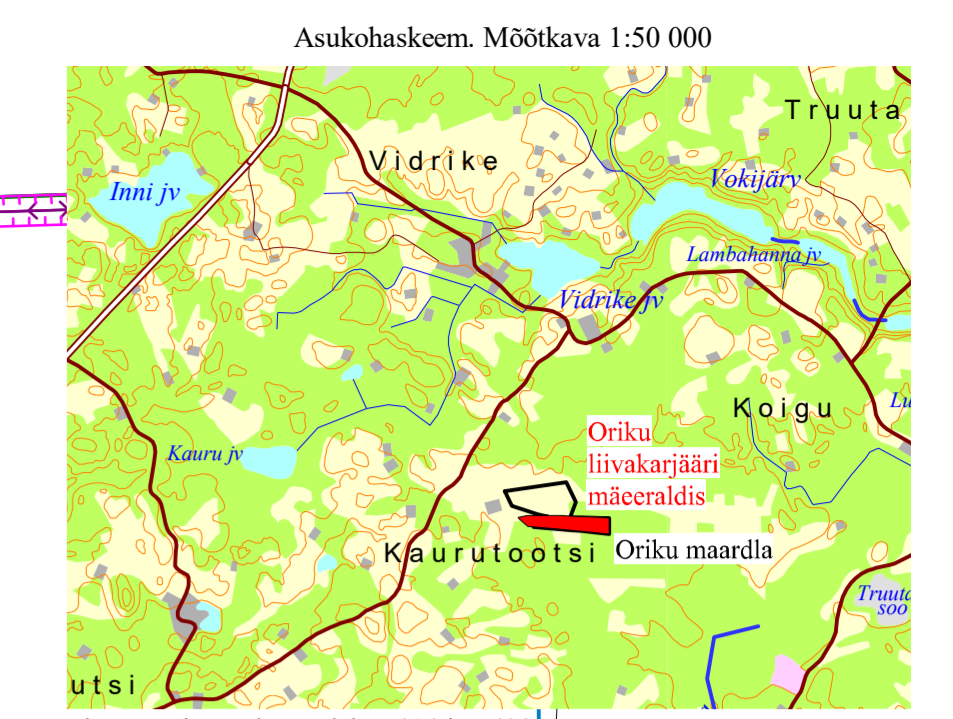
Alus, Eesti Baaskaart, leht 5414 ja 5423